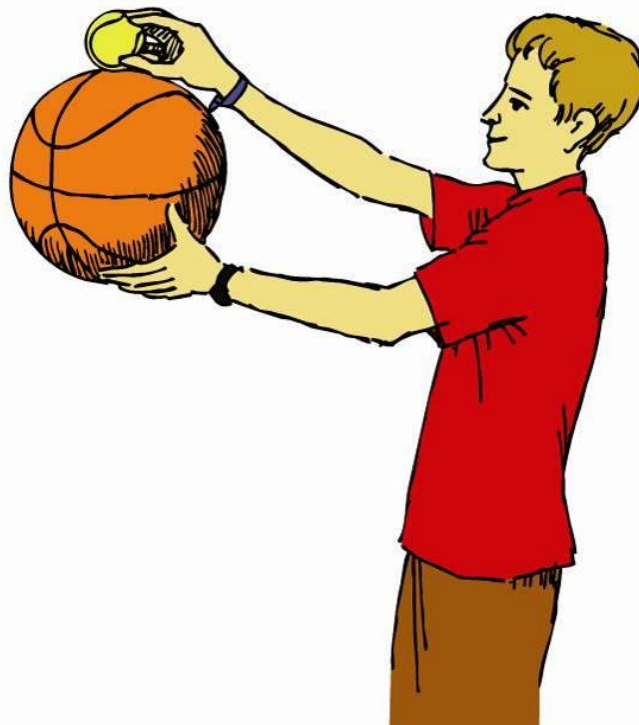
Figura 2: Forma de realizar el experimento.

Al llegar al suelo, el balón grande rebota y empieza a subir. En ese momento choca con la pequeña pelota de tenis que baja y, como hay mucha diferencia de masas, la pequeña sale despedida a gran velocidad hacia arriba. Si estos choques se repitiesen con varias bolas cada vez más ligeras que cayesen, las velocidades que se conseguirían serían fantásticas.